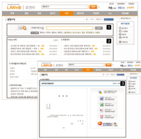
〈검색 예시-사직서 작성요령〉